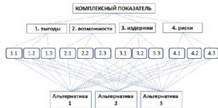
Рис. 1. Сетевая модель

На основе МАС построена модель (сетевая структура) исследуемого объекта, содержащая четыре подсети, связанные с соответствующими 12 критериями управления, и проведена оценка трех альтернативных вариантов достижения поставленной цели (рис. 1).